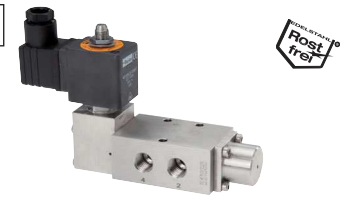
5/2-Wege mit Federrückstellung

24V= (Standard) . . . . .-24V= 230V AC (Standard) . . . . .-230V 24V AC . . . . .-24VAC 115V AV . . . . .-115V